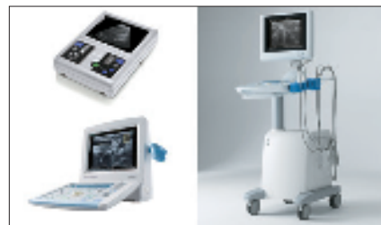
医療機器 Medical Diagnostic Device

電線圧縮接続機 Compression Head and Hydraulic Pump, Hydraulic Puller, Hydraulic Tensioner