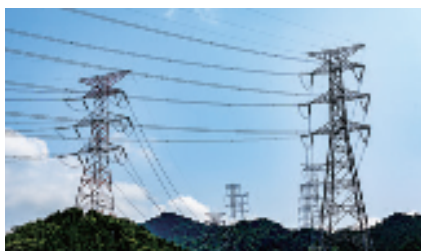
送電工事用機械類 Machinery and Tools for Transmission Line

配線を一つのダクトに収めた電力幹線 Duct Containing Busbars for conducting a current of electricity