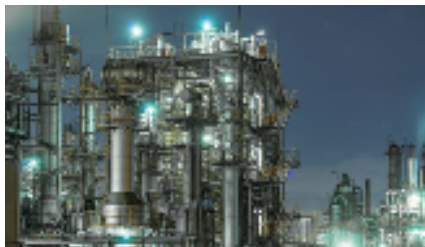
防爆照明機器 Explosion Proof Type LED Lighting Fitting

爆発性雰囲気のある危険個所で使用する照明器具 Lighting Fitting for using in hazardous areas with explosive atmospheres