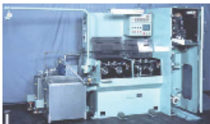
伸線機 Drawing Machine

各種線材用伸線機・圧延ライン Various type of Wire Drawing Machine and Rolling Line