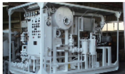
脱気装置 High Vacuum Oil Purifiers

超音波診断装置など Ultrasonic Diagnostic Scanner (for human/animal)