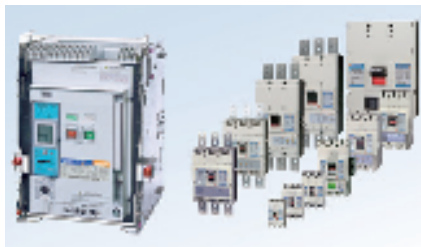
ブレーカー類 Circuit Breaker

配線用遮断器、漏電遮断器、気中遮断器 Circuit Breaker, Earth Leakage Circuit Breaker and Air Circuit Breaker