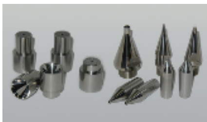
ダイス、ニップル Extruding Die

各種線材用伸線機・圧延ライン Various type of Wire Drawing Machine and Rolling Line